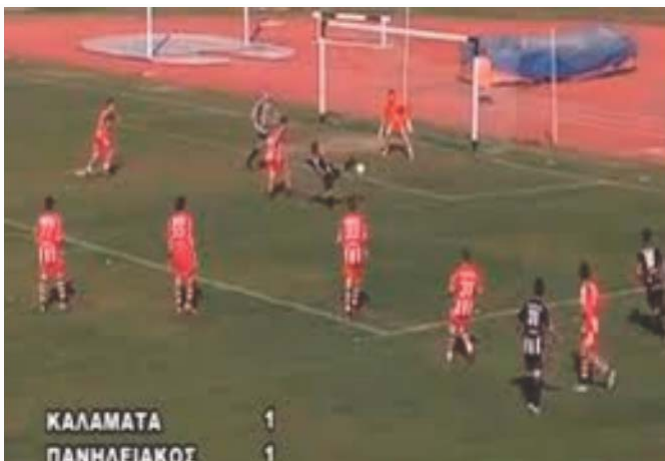
ΚΑΛΑΜΑΤΑ 1 ΠΑΝΗΛΕΙΑΚΟΣ 1